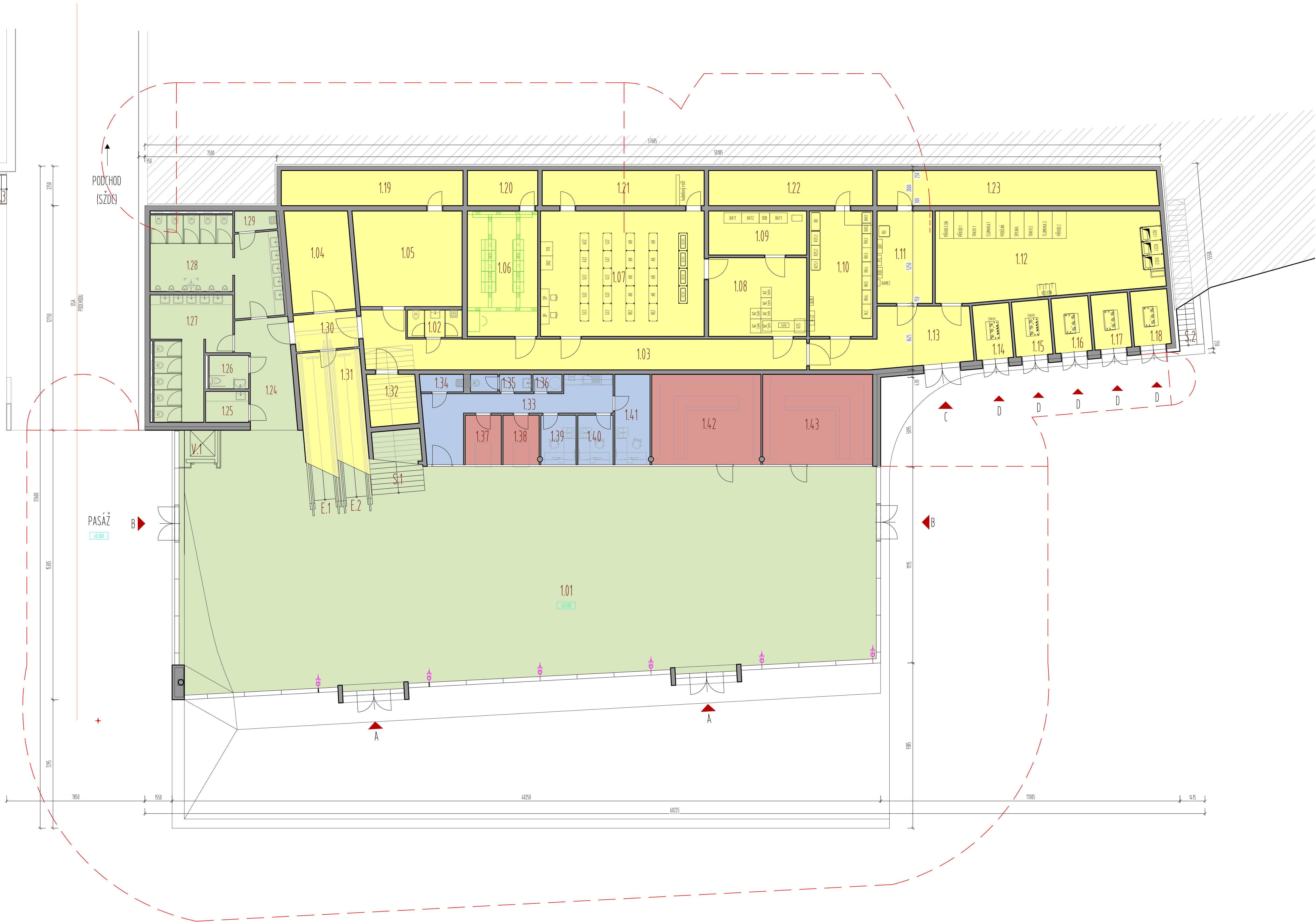
TABULKA MÍSTNOSTÍ 1NP - NAVRHOVANÝ STAV